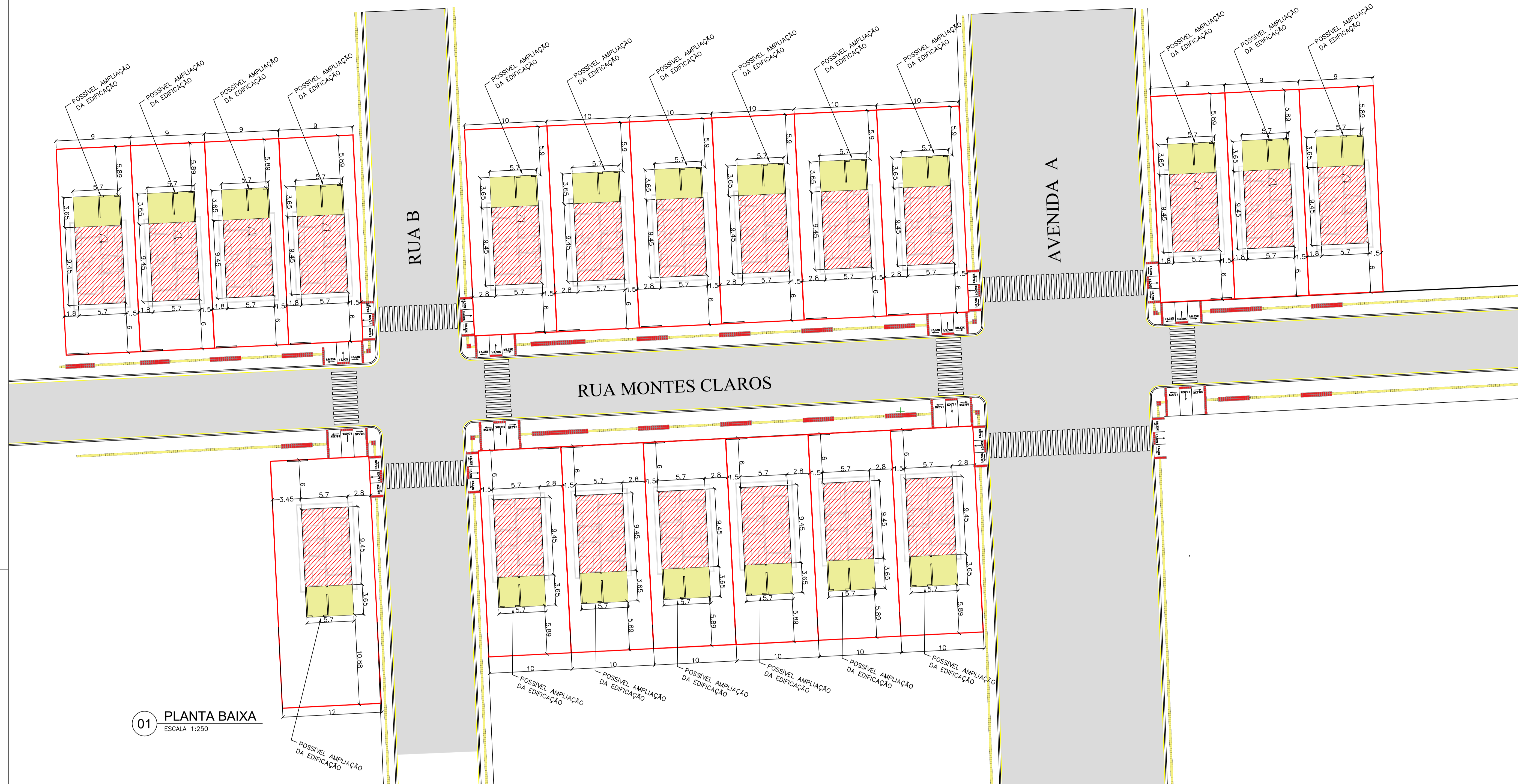
01 PLANTA BAIXA ESCALA 1:250